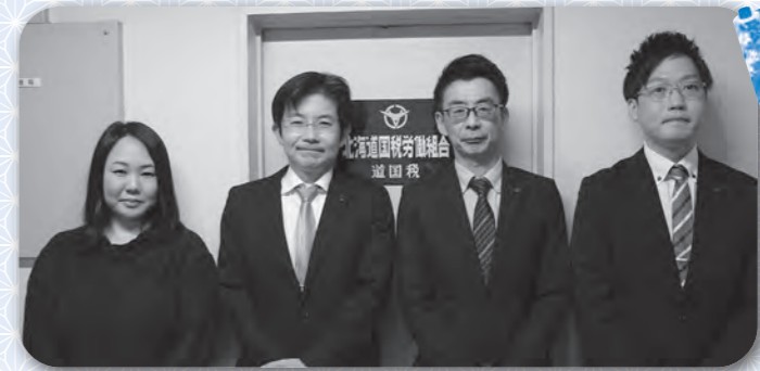
▶左から 今川書記 富沢書記長 森岡委員長 中田青年部長